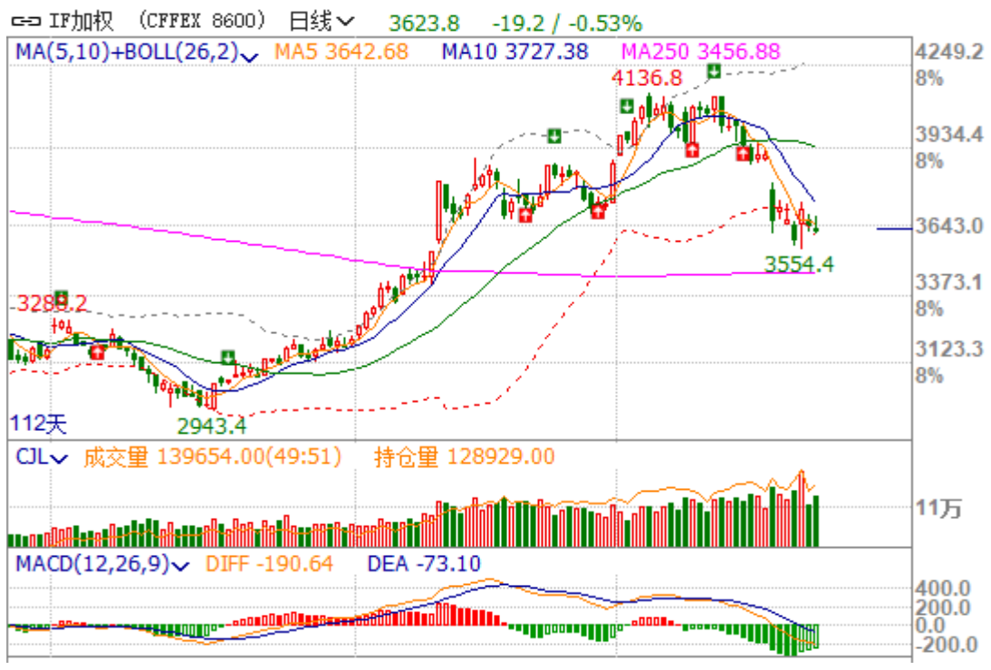
图 3：沪深 300 股指期货加权指数

从技术面来看，沪深 300 股指期货目前处于反弹之后的回踩阶段，上方 10 日均线附近压力非常明显。如果最近两三天还不能反弹至 10 日均线上方，则后市大概率上将延续之前的强势下跌趋势行情。