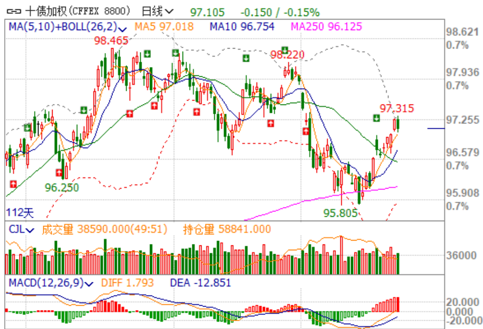
图 4：十债期货近期走势

今日国债期货的价格整体小幅回调。从图 4 可以看到，十债加权平开之后，全天收效阴线，几乎将昨日的涨幅全部吞没。而且，持仓量继续下降，说明多头有意逢高减仓，也预示价格短线存在调整的压力，布林带上轨的阻力是异常巨大的。从稳健操作的角度来说，耐心等待价格回调至布林带中轨附近再去做多更为合适。