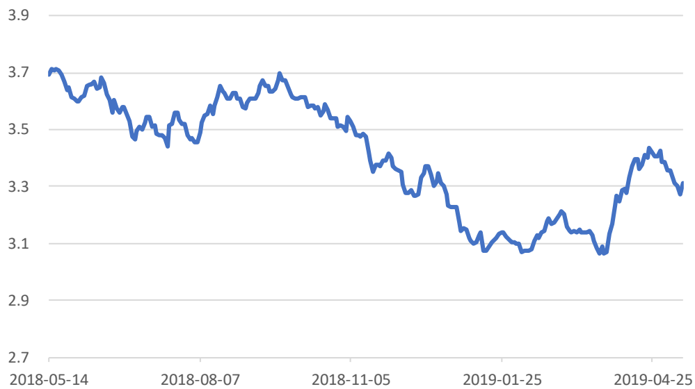
图 5：十债现货到期收益率（%）