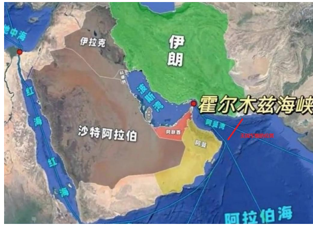
图 3：美军封锁霍尔木兹海峡示意图

和平船只开火的伊朗人都将被干掉。”他还称，“伊朗比任何人都清楚如何结束这一局势。”对特朗普这一最新威胁，目前伊朗方面还没有作出回应。这也意味着，中东一滴油都将不能流出霍尔木兹海峡。